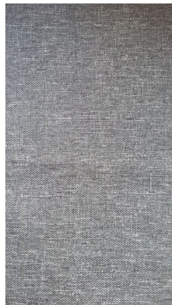
SOUPRAVA MONTREAL - SOFA